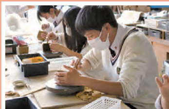
陶芸デザインの授業