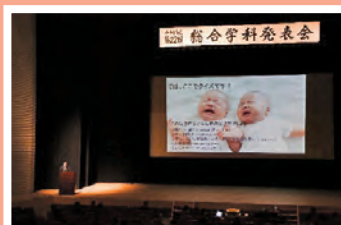
晃輝祭(総合学科発表会)