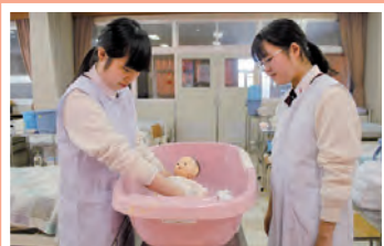
人体と看護の授業