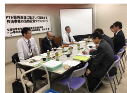
茨城県PTA安全互助会立入検査の様子