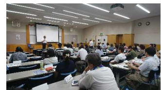
都高P全都会長会 改正個人情報保護法の説明