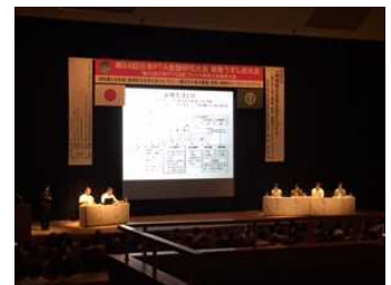
第64回日本PTA全国研究大会 特別第2分科会

■ 編集後記 子ども達は、早いところでは夏休みも終わり、2学期も始まっている頃だと思います。我が息子は、夏休みに入るなり山形県での免許合宿に行き、その後もサッカー合宿やら…合宿やらで、家に帰ってこない日が多いです。(一人暮らしへの憧れがあるようです。)免許を取ると車を運転したくなるのが当然、しかし、最初から一人では他人様に迷惑をかけてしまうので、しばらくは私が助手席にのり、息子に命を預けて、夜な夜な近所を練習しています。どうせ運転するのなら雨の日くらいは駅まで迎えに来てほしいと、繰り返しそのルートを練習中です。思えば自分の時もそうでした。父親のOKが出るまでは一人での運転は禁止されました。教官以上に厳しかったと記憶しています。車を運転することで社会的な責任も発生し、違反や事故を起こしたら相応の罰も受けるようになります。少しずつ感じていますが、子どもを一人前の大人として手放す時期に来ているのかもしれない。子を通して、自分の親の複雑な気持ちも感じる日々です。共済も運転も「安心・安全」が一番。第三者や物の補償は、賠償保険で。(PTA等共済室：吉谷)