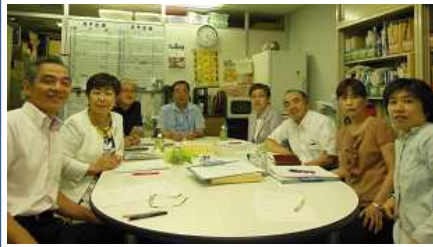
安全共済会審査員部会の様子

役員と事務局との連携をとりながら、コンプライアンスの遵守を心がけた組織運営に努めております。また、審査委員や運営委員としての役割分担も共済事業の運営をする中で重要な役割を果たしています。